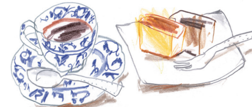
ちよこつと セヴィリヤ

佐賀の出身なのですが、佐賀では冠婚葬祭やおみやげに、よく丸ぼうろを使います。丸ぼうろは、カステラの焼き方を教わって作られたという説もあります。長崎と佐賀がシュガーロードでつながっていたことを感じさせるエピソードですよ